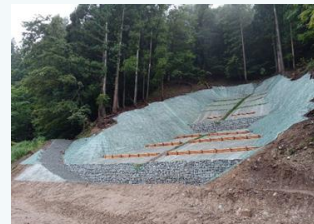
海上地区の治山事業 (新温泉町)