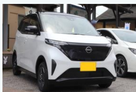
電気自動車の導入 (神河町)