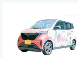
電気自動車の導入 (加東市)