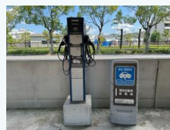
充電設備の整備 (太子町)