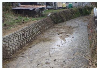
上比延谷川の土砂撤去 (西脇市)