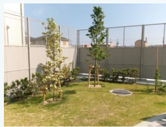
公園の緑化(姫路市)