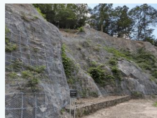
但東町正法寺地区の治山事業 (豊岡市)