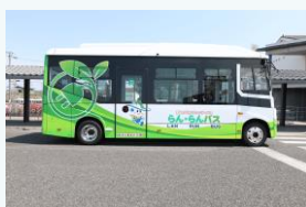
電気バスの導入 (南あわじ市)