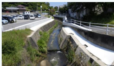
畑川の護岸改修 (淡路市)