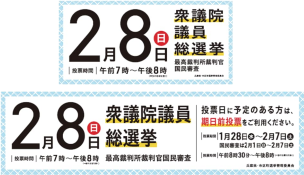
車両上部取付看板(前後・左右)