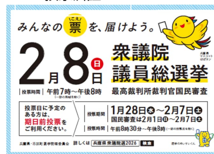
ポケットティッシュ