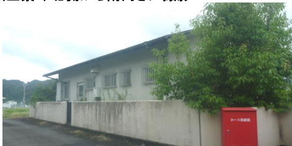
(全景2) 北側から南向きに撮影