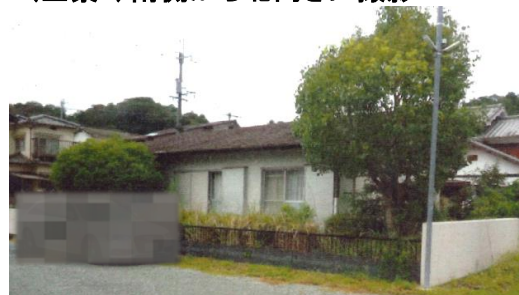
(全景3) 南側から北向きに撮影