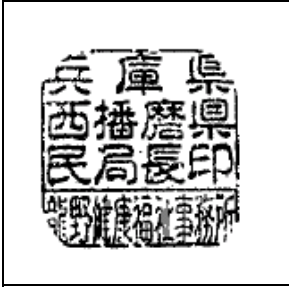
兵庫県西播磨県民局長印 (龍野健康福祉事務所)