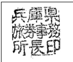
兵庫県旅券事務所長印