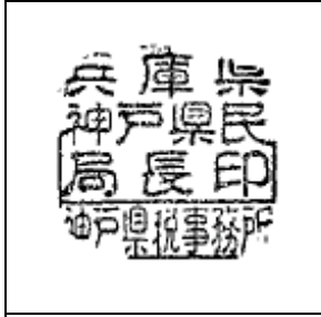
兵庫県神戸県民局長印 (神戸県税事務所)