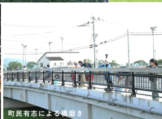
町民有志による橋磨き