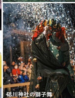
砥川神社の獅子舞