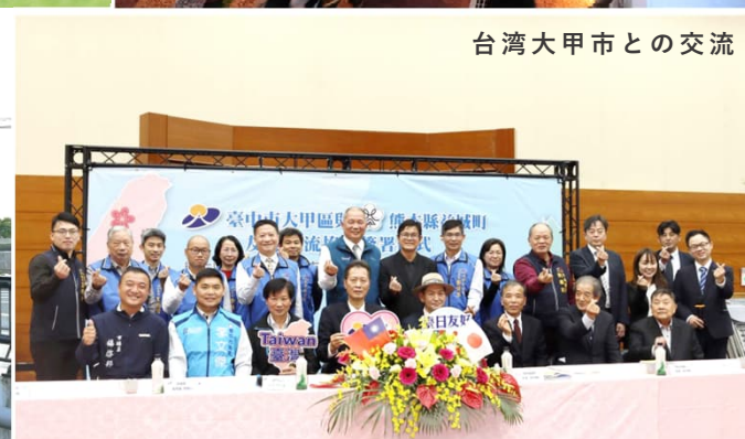
台湾大甲市との交流