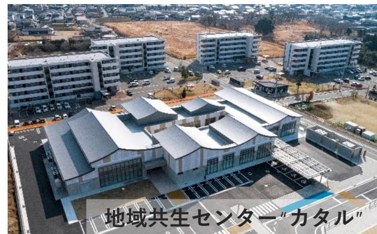
地域共生センター「カタール」