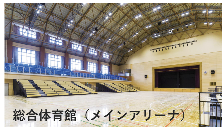
総合体育館（メインアリーナ）