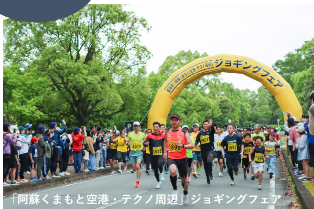
「阿蘇くまもと空港・テクノ周辺」ジョギングフェア