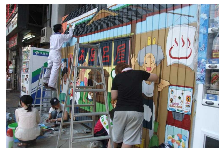
シャッターへの壁画作成