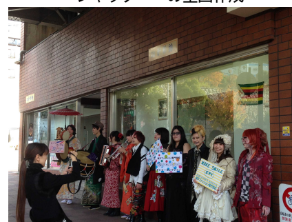
モトコーコレクションの様子