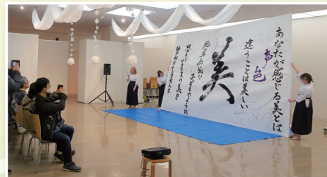
神戸松蔭女子学院大学 書道コース