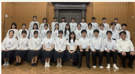
兵庫県立神戸高校 合唱部