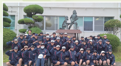
兵庫県立舞子高校 環境防災科