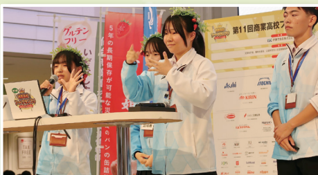
兵庫県立姫路商業高校