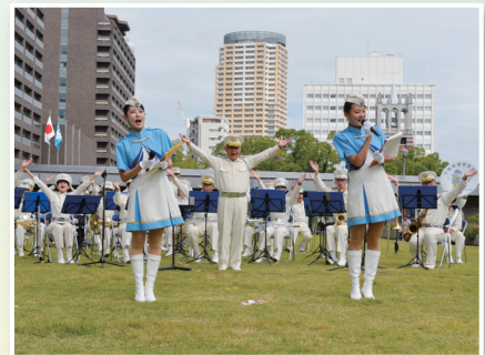
兵庫県警察音楽隊