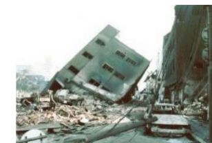
阪神・淡路大震災（H7）