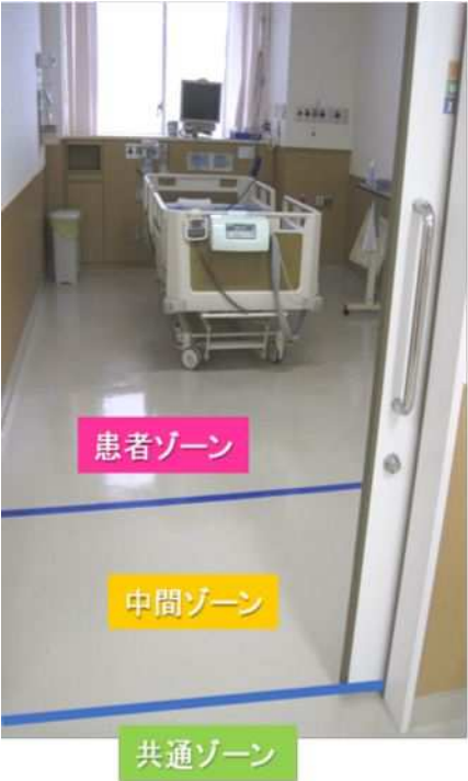
病室ゾーニングの1例