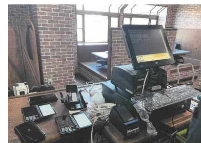
飲食店の注文受注・会計の業務システム化