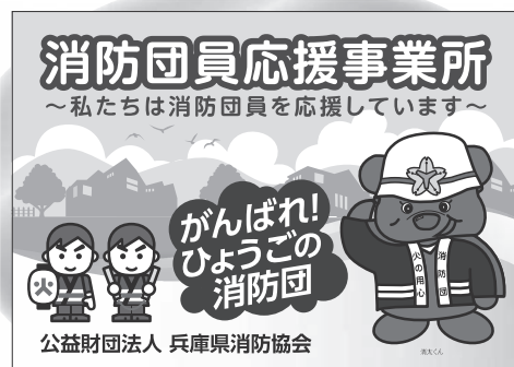
▲消防団員応援事業所ステッカー

※ご登録いただいた事業所には、(公財)兵庫県消防協会マスコット“消太くん”をデザインした『消防団員応援事業所ステッカー』を交付しますので、店頭などに掲出いただけます。 ※「消防団員を応援しているお店」として、店舗や事業所のPR・イメージアップになるとともに、社会貢献にもつながります。