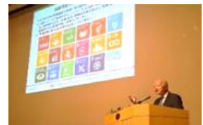
【里山・里海国際フォーラム】

テーマ領域(例示) 気候変動、脱炭素、生物多様性、サーキュラーエコノミー、再生可能エネルギー、水素社会、ネイチャーポジティブ、森林破壊、海洋汚染、里山再生、淡水資源 など