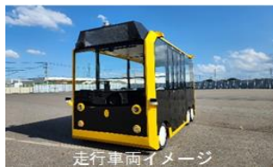
走行車両イメージ

テーマ領域(例示) スマートシティ、デジタル田園都市、防災・復興、メタバース、宇宙、ロボット、EV・FCV、自動運転、空飛ぶクルマ、サイバーセキュリティ、MaaS など