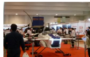
【国際フロンティア産業メッセ】

テーマ領域(例示) 水素等新エネルギー、航空、ドローン、空飛ぶクルマ、ロボット、半導体、健康医療産業、産学官連携、オンリーワン技術、地場産業、伝統的工芸品、ブランド化、海外展開 など