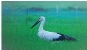
【環境創造型農業サミット】

テーマ領域(例示) フードロス、フードテック、食育、食文化、スマート農林水産業、サステナブルファッション、エシカル消費 など