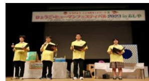
【ひょうご・ヒューマンフェスティバル】

テーマ領域(例示) 飢餓、貧困、格差社会、人権侵害、児童労働・強制労働、人身売買、障がい者参加、ジェンダー平等、LGBTQ、女性の活躍推進、移民、人間の安全保障、多様性と包摂性など