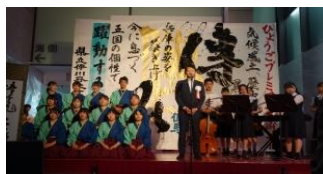
【ひょうごプレミアム芸術デー】

テーマ領域(例示) 伝統芸能、歴史遺産、地域活性化、観光、アート、音楽、スポーツ、文化芸術、クールジャパン、マンガ・アニメ、eスポーツ など