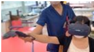
【先端医療技術展示・体験】

テーマ領域(例示) 感染症対策、ウェルビーイング、ゲノム医療、再生・細胞医療、遺伝子治療、PHR、健康寿命、SBNR、安全な水とトイレ など