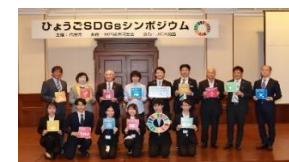
【ひょうごSDGsシンポジウム】

テーマ領域(例示) SDGs、ポストSDGs、いのち、未来社会、Society5.0 など