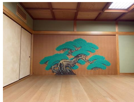
▲家の中にある能舞台