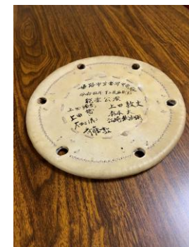
▲小鼓の革にサイン