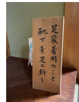
▲能舞台は靴下も禁止