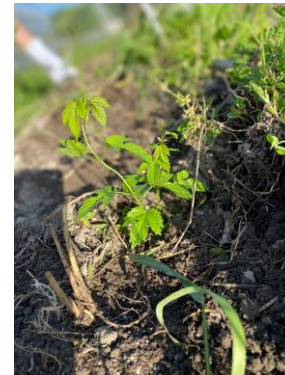
▲ホップの植え付け