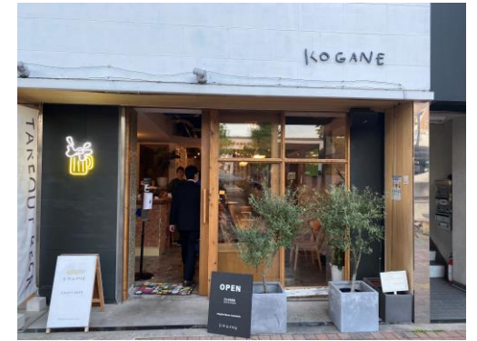
▲クラフトビール醸造工場とお店