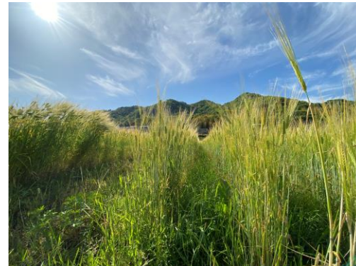
▲耕作放棄地を活用し大麦畑