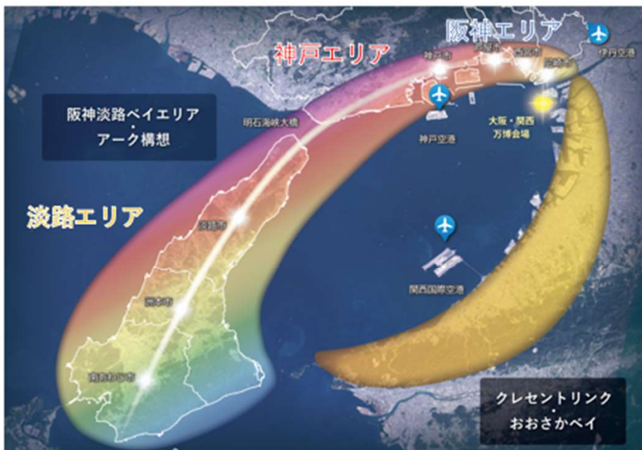
阪神・淡路ベイエリア・アーク構想 イメージ図

2025年大阪・関西万博開催、2030年前後の神戸空港国際化等のインパクトを見据えつつ、阪神・淡路ベイエリアの将来像と、ベイエリア活性化に向けた多様な主体による取組の基本的な方向性を示す長期構想を策定する。