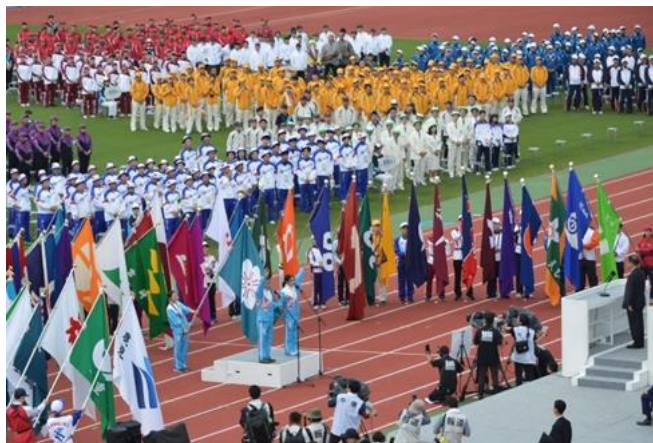
※昨年度、佐賀国スポ総合開会式の様子

2015 年の和歌山国体以来、10 年ぶりに近畿で開催される国民スポーツ大会「わた SHIGA 輝く国スポ」。9 月 28 日（日）には総合開会式が滋賀県彦根市で行われ、その後、本会期の 34 競技が県内各地（一部県外開催あり）で順次実施されます。