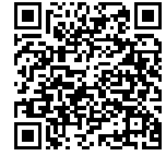
令和3年「土木の日」 湊川隧道通り抜け申込