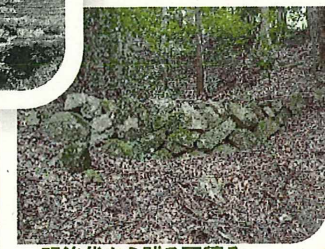
明治代から残る石積み