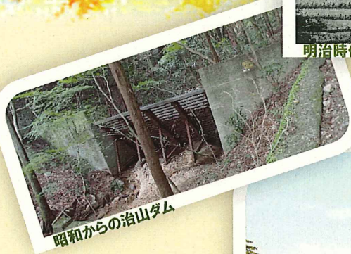
昭和からの治山ダム