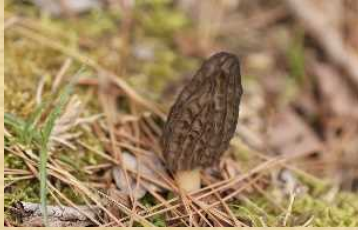
トガリ アミガサタケ