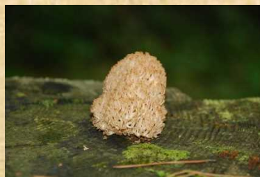
フサヒメホウキタケ