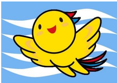
兵庫県神戸県民センター助成事業