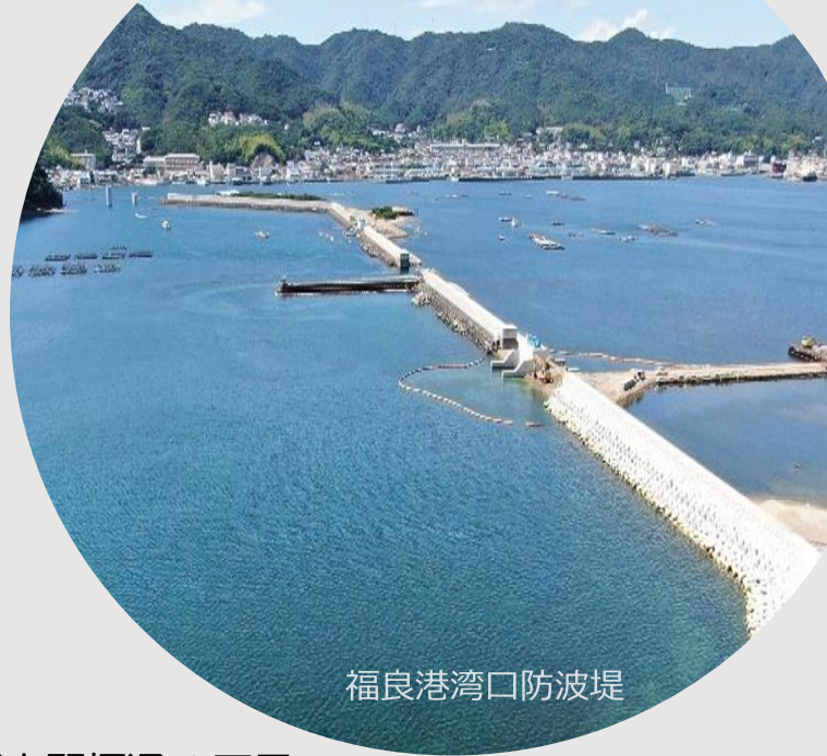
福良港湾口防波堤