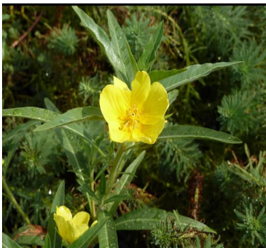
オオバナミズキンバ