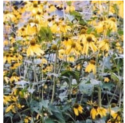
オオハンゴンソウ