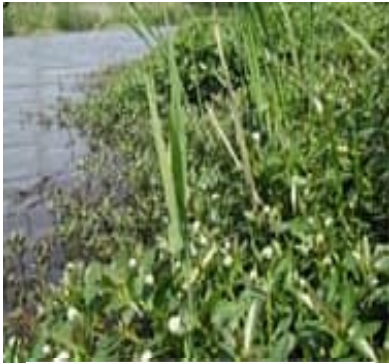
ナガエツルノゲイト