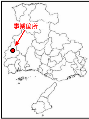
計画概略図 縮尺 1:10,000