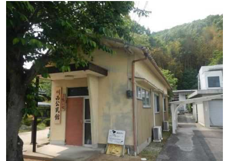
④保全対象(川西公民館)