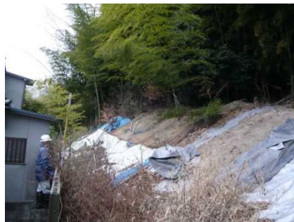
③保全対象とがけの状況