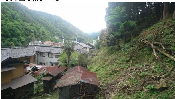
②斜面(人家裏)及び保全対象の状況