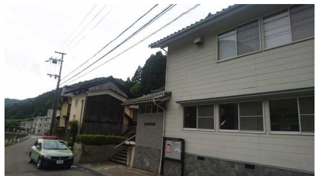
③保全対象 出合公会堂 (避難所)