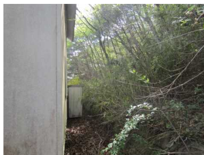
③保全対象とがけの状況