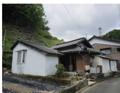
②斜面と保全対象の状況