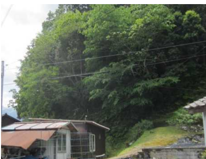
①斜面(人家裏)と保全対象の状況