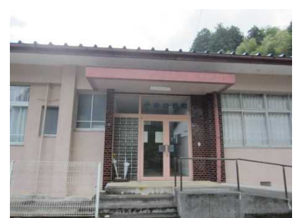
③保全対象 小谷公民館(避難所)