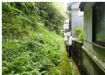
②斜面(人家裏)と保全対象の状況