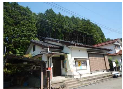
③保全対象 緑ヶ丘公民館 (避難所)