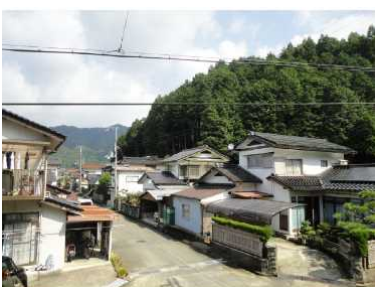
①斜面と保全対象の状況