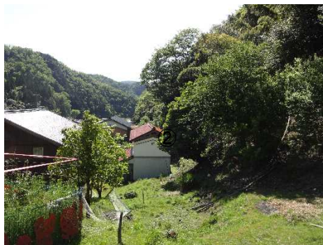
③保全対象とがけの状況