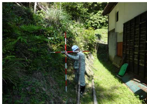
③ 保全対象とがけの状況