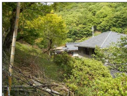
③保全対象とがけの状況