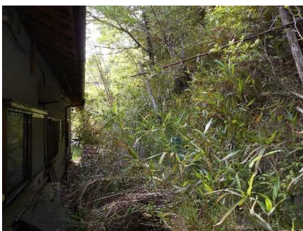
②保全対象とがけの状況