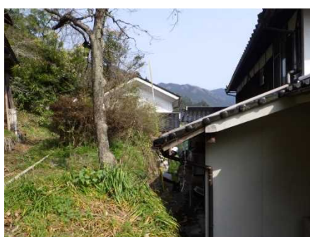
③保全対象とがけの状況