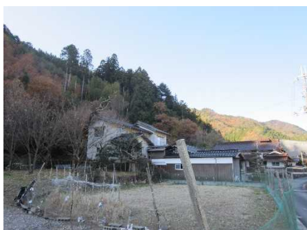
②保全対象とがけの状況