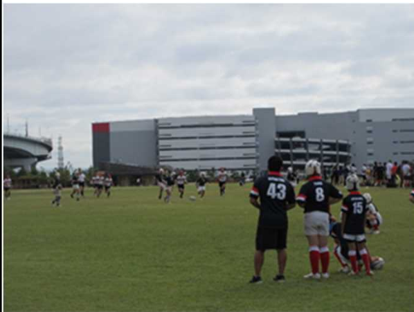
スポーツフェスタ(第1工区)