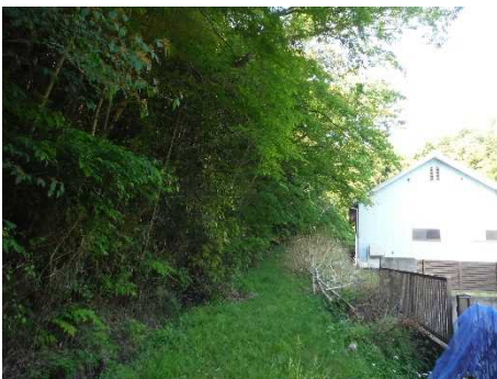
②保全対象とがけの状況