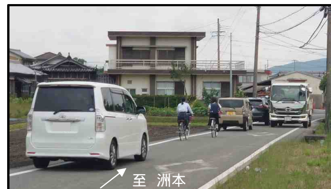
幅員狭小による離合困難