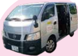
西脇市 シャトルバス