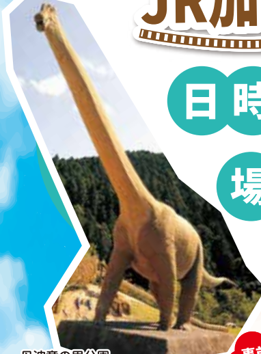
丹波竜の里公園 (丹波市山南町)

※雨天決行、ただし当日朝6時時点で兵庫県北播丹波地方に警報が発表された場合は中止(でんくうまつりも中止)