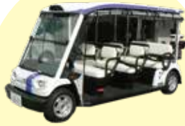
グリーンスロー モビリティ