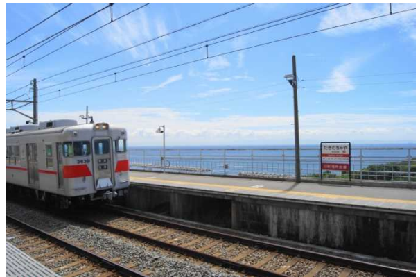
滝の茶屋駅からの景色