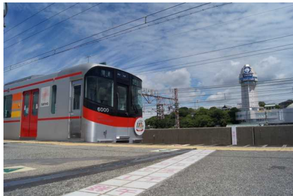
人丸前駅の子午線と天文科学館