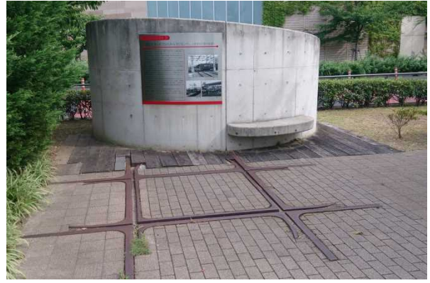
高松ひなた緑地（阪急西宮北口駅）