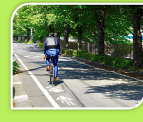
令和元年5月 自転車活用推進官民連携協議会