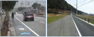
車道混在 路肩拡幅