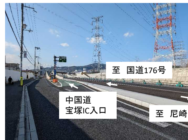
小浜南交差点（信号交差点の廃止）（宝塚市）