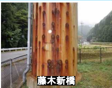
【橋脚巻立て鋼板の腐食】