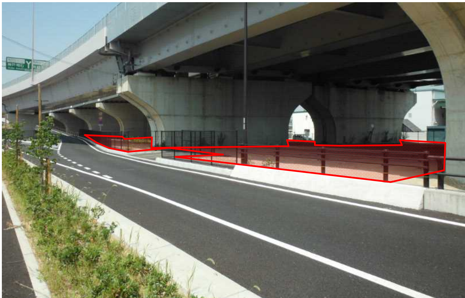
(3) 現地写真(物件番号:④)