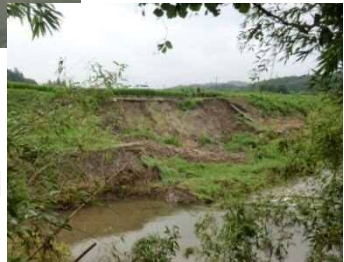
(一) 美嚢川 【三木市 細川町】