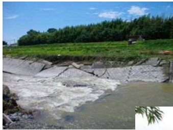
(二) 明石川 【神戸市西区平野町】