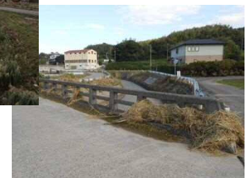
(二)岩戸川【洲本市安乎町】