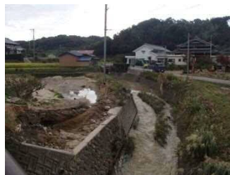
(二)山田川【淡路市草香】