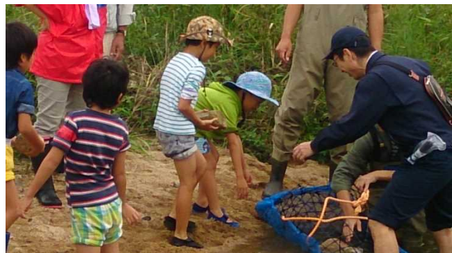
うわっ！投げんなよ！