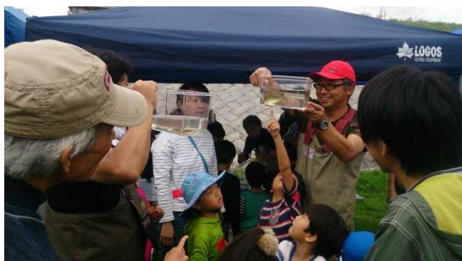
下から見て、カマツカと比べてみ