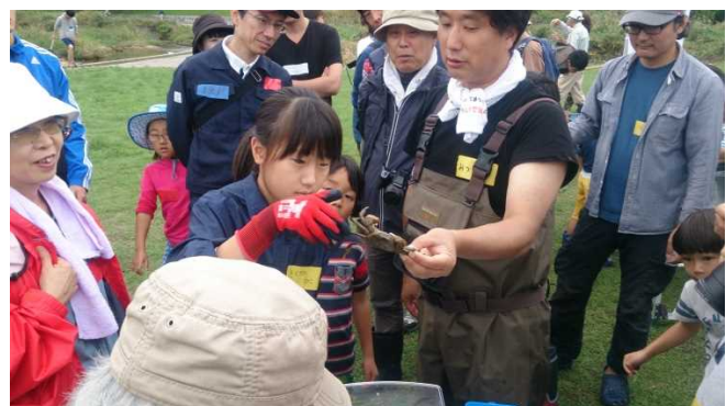
片方4本を持つと暴れなくなるよ