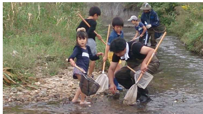
この石をめくるとね、あ、聞いてない