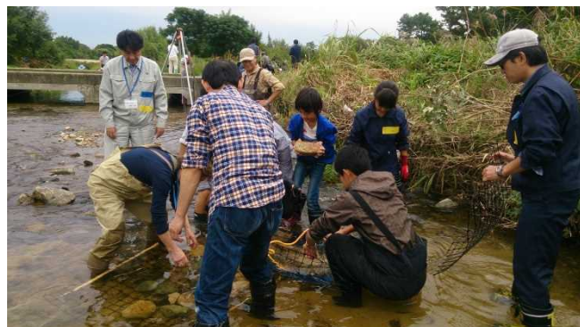
よっしゃ、石入れよか