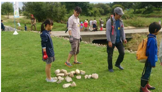
この石どないしよ