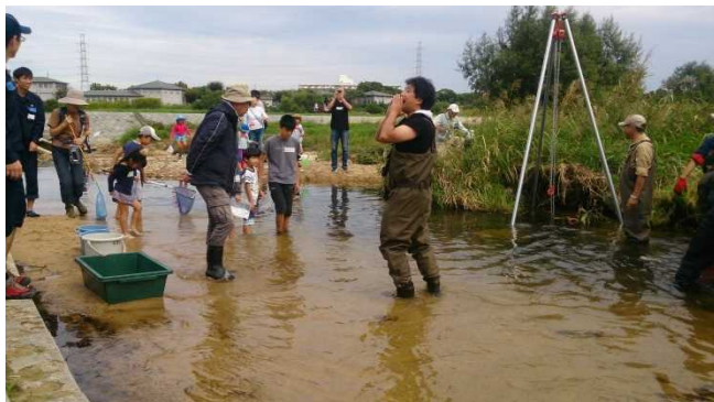
はい、上げますよー