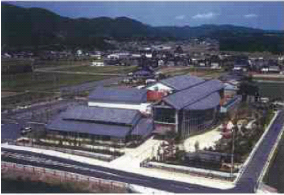
■篠山市民センター（篠山市）