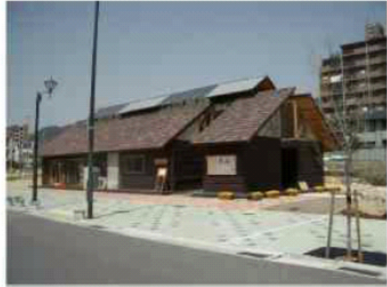
■安心コミュニティザ 風の家（神戸市灘区）