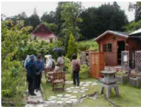
■特定非営利活動法人 さわやか緑花クラブ(猪名川町)