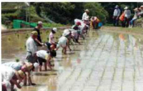
■田和棚田交流人(所在地:宝塚市、活動地域:佐用町)