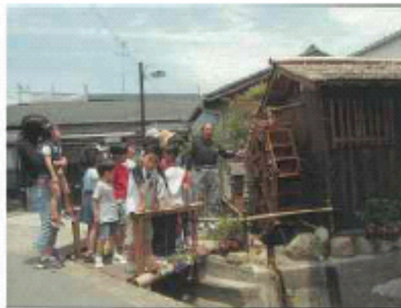
■北村景観形成協議会(伊丹市)