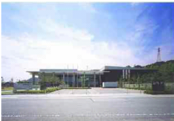
■姫路市埋蔵文化財センター（姫路市）