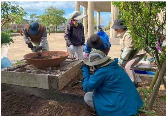
花緑団体中間支援団体による 土壌改良の指導

花緑団体中間支援団体に対する支援などの緑化基金事業は、財源の安定・継続した確保が課題。また、淡路景観園芸学校ではまちづくりガーデナーを育成・認定しているが、応募が定員に満たない状況が続いている。維持管理ガイドブックを作成したが、活用方法について検討が必要。