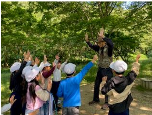
環境体験事業における里山での活動

兵庫楽農生活センター体験者はコロナ禍により大きく減少し、現在は回復傾向にあるが、引き続き、新たな体験メニューや研修の充実等、集客力の向上に向け、施設全体の魅力アップを図る必要がある。