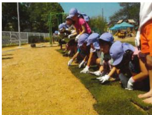
園児による芝生張り