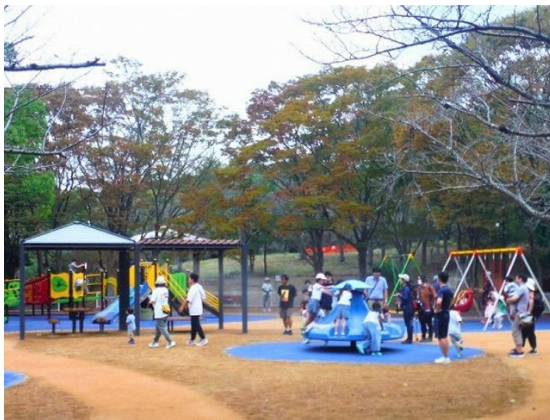
県立都市公園の遊具のリニューアル（明石公園）