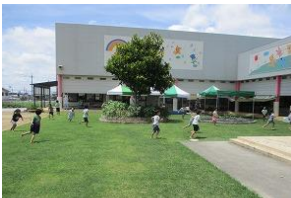
芝生化された園庭

子どもの冒険ひろば事業は事業目標を達成したため終了予定(R7)。現在、企業と連携した取組について検討中。