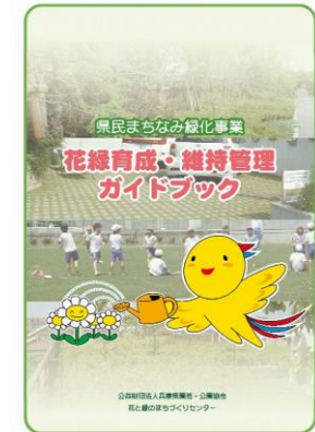
維持管理ガイドブック