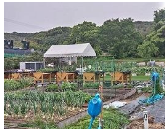
市街化調整区域の市民農園

全15の県立都市公園においてリノベーション計画を策定し、計画を基に公園施設の再整備を進めている。市民農園は開設者の高齢化等により廃止される農園があるため減少傾向だが、ニーズの高い都市部では増加。引き続き、既存農園の利用促進と、ニーズに応じた新規開設と機能強化を進める必要がある。