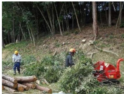
地域住民による伐採木のチップ化