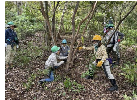
森林ボランティア講座