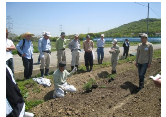
楽農学校事業（兵庫楽農生活センター）での栽培技術指導