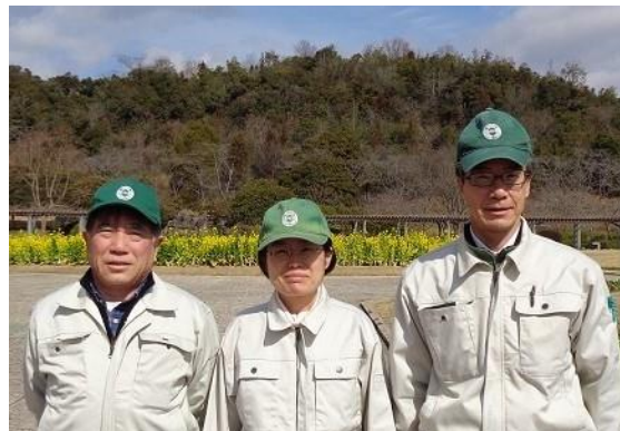
緑のパトロール隊