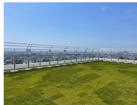
屋上緑化（県民まちなみ緑化事業）