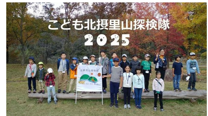
里山をフィールドとした小中学生対象環境学習