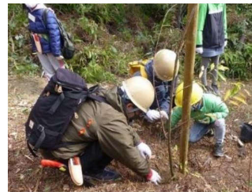
企業の社員家族による植樹活動