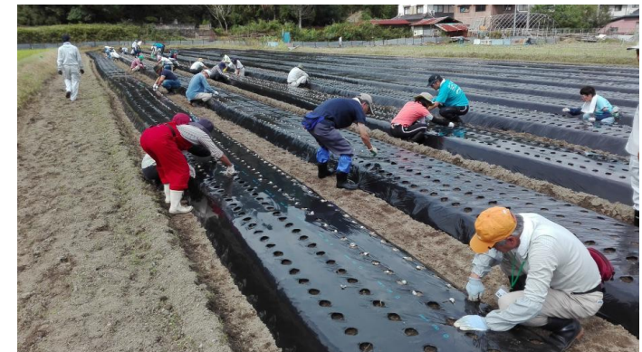
都市住民による農村ボランティア活動