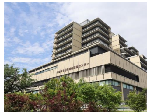
環境条例による義務緑化