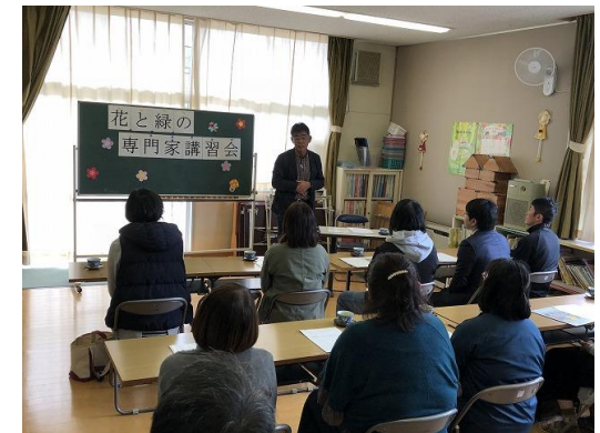
花と緑の専門家講習会