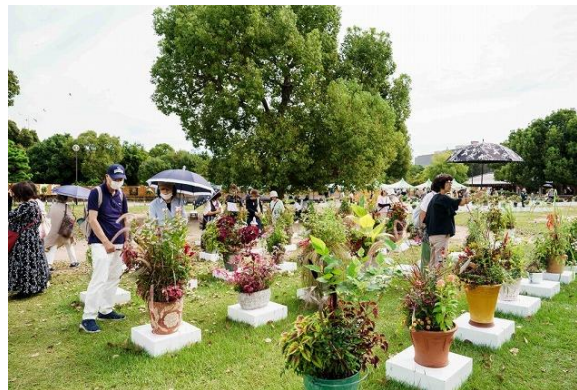
ひょうごまちなみガーデンショー