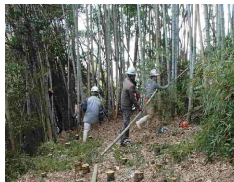
災害に強い森づくり