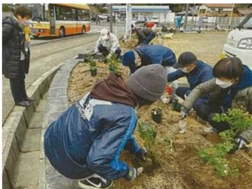
地域住民による緑化活動

住民団体による県民まちなみ緑化事業の申請件数が860団体（R3～R6計）と目標を達成したが、住民団体の高齢化による活動の継続や若い世代の緑化活動ニーズへの対応が課題となっている。