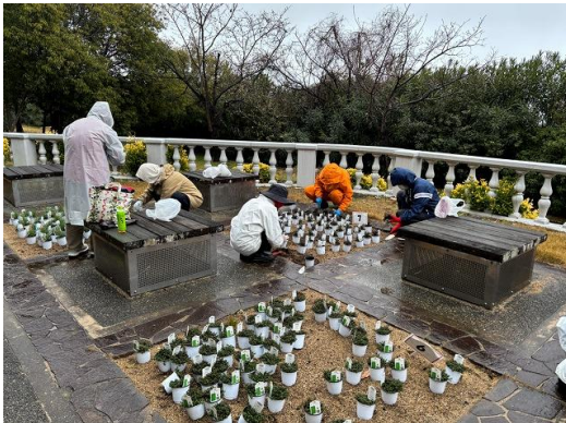
花と緑のまちづくりセンターによるワークショップ

花と緑のまちづくりセンターによるワークショップなどの普及啓発や緑のパトロール隊による活動等を継続して実施しているが、財源（緑化基金）の安定・継続した確保が課題。森林ボランティア講座により、847人(R6)の森林ボランティアリーダーがいるが、若手リーダーが不足している。