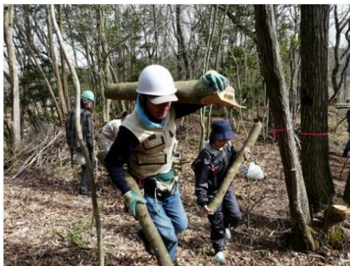
住民団体による森林整備活動

間伐実施面積約15万ha(累計)、里山林再生面積約2万ha(累計)と、目標に向けて着実に進捗が見られ、行政のみならず住民団体参加型の森林整備活動が進んでいる。また、里山資源を活用した市民大学講座の開講や子ども向けの環境学習の実施により里山への理解を深めている。