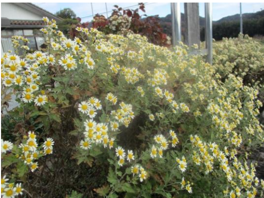
苗から育て、開花したのじぎく

一方、のじぎくの里づくり事業による苗の配布数は減少傾向であるなど、地域による景観形成の継続性の確保が課題となっている。