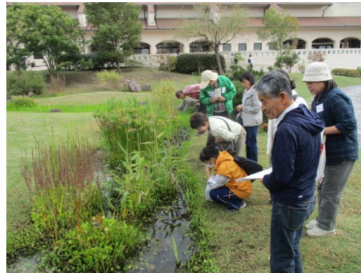
まちづくりガーデナーコースの実習 (淡路景観園芸学校HPより)