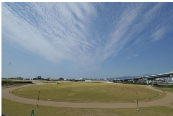
避難地・防災拠点の空間 (尼崎の森中央緑地)