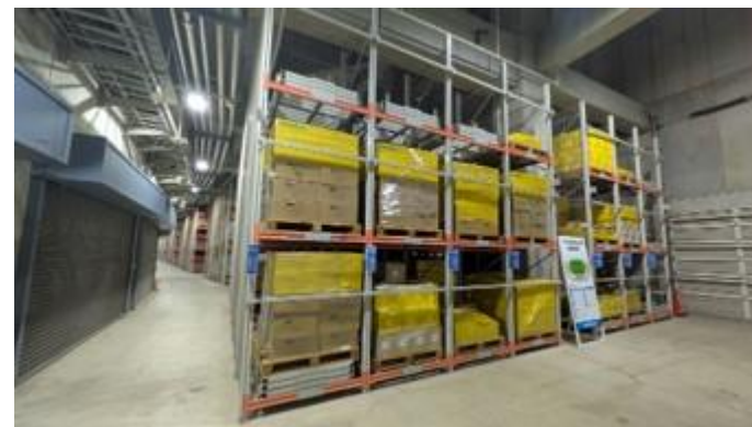
防災拠点としての利用 (三木総合防災公園)

県地域防災計画で広域防災拠点に位置付けられている県立都市公園の整備が完了(H30)。防災拠点や広域避難地としての役割を担うため防災機能を維持している。また、防災訓練や防災イベントを実施している。