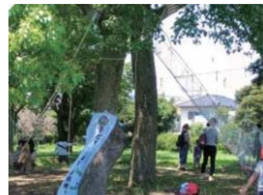
子どもの冒険ひろばの様子