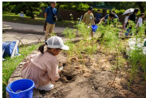
キッズガーデニング体験