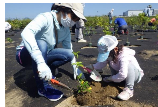
環境学習の場としての提供

環境学習・環境教育への支援を行うとともに、表彰制度を創設するなど普及啓発とPRを図っている。一方、指導員人材の不足や活用フィールド・テーマの偏り等が課題。