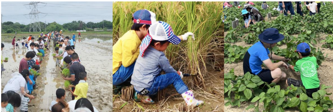
親子農業体験教室

楽農生活交流人口等の都市農村交流施設の利用者数）は、体験機会の提供や都市農村交流活動への支援等に取り組み、着実に増加している。引き続き、都市住民と農村地域のマッチング等を推進し、連携強化を図る必要がある。