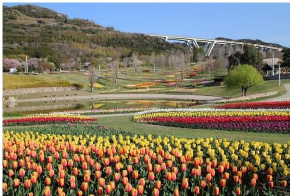
淡路花博25周年記念花みどりフェア