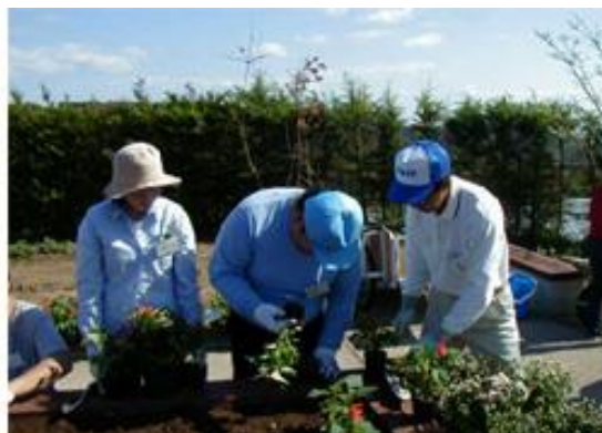
園芸療法士の育成 （淡路景観園芸学校HPより）