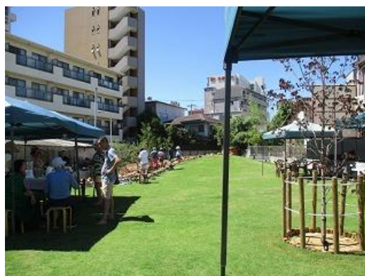
緑地の活用により 地域の交流が拡大