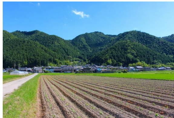
緑条例による整備計画の認定 (丹波篠山市宇土地区)