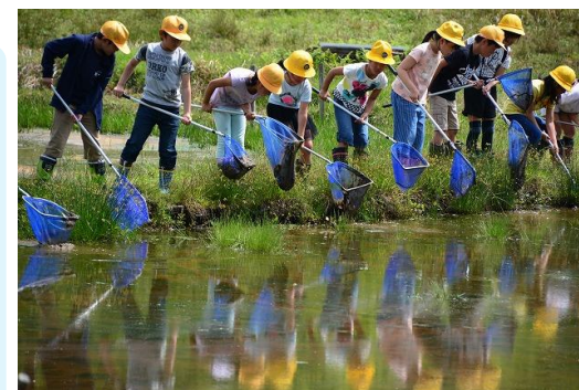
コウノトリの郷公園環境学習