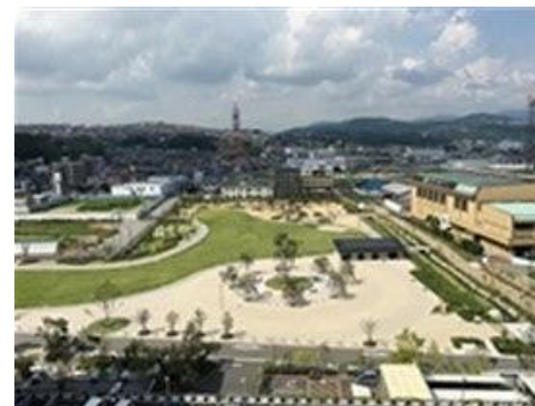
大規模な都心緑化の支援（県民まちなみ緑化事業）