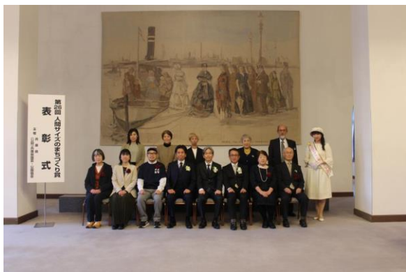
人間サイズのまちづくり賞（花緑活動部門）表彰式と活動の様子

企業との協定締結数は48社(R6)に増加したが、県内企業への制度周知や現地指導者が不足している。