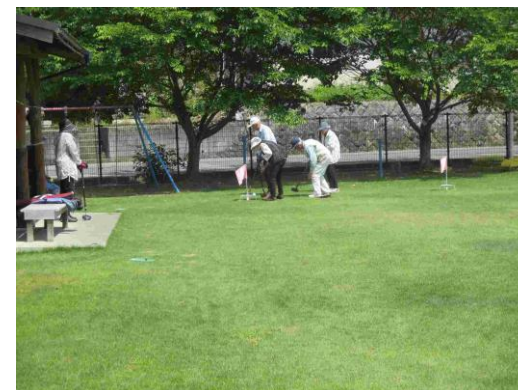
芝生化した広場でのグランドゴルフ

県立都市公園では各種運動教室や健康づくりイベントを実施し、心身の健康づくりに寄与している。