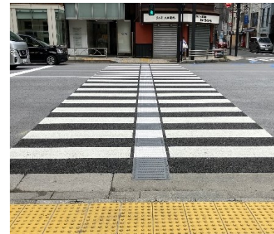
＜エスコートゾーンの例＞